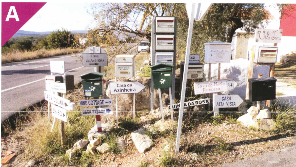
Situação atual . Actual situation