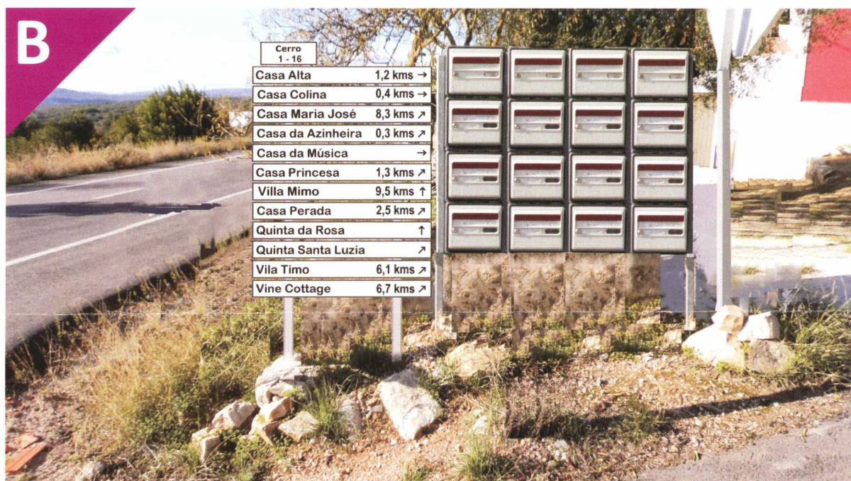
Imagem que se pretende obter . Image we want to achieve