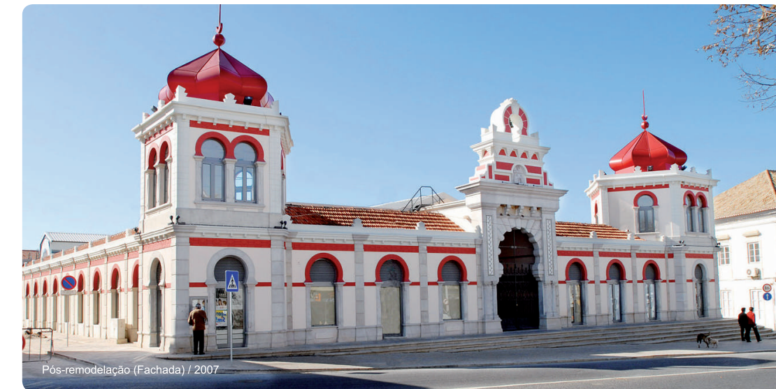
Pós-remodelação (Fachada) / 2007