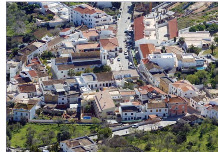
Vista de Boliqueime