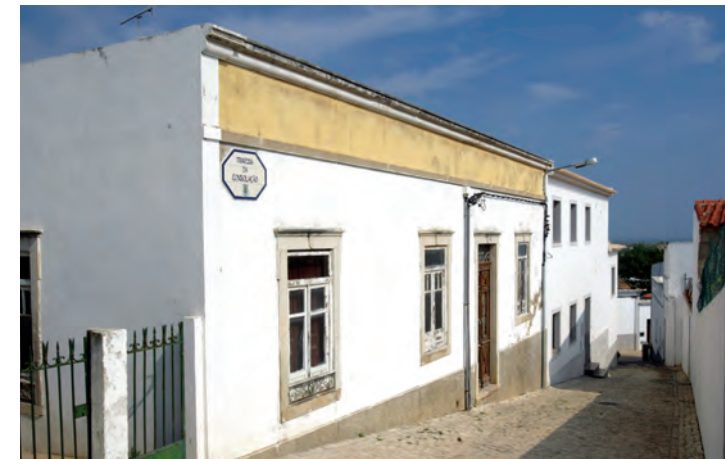
Rua de Boliqueime