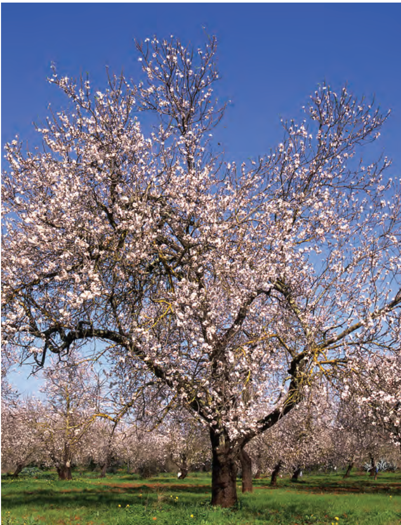
Amendoeiras em flôr