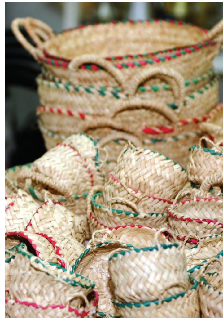
Cestaria tradicional em palma