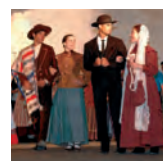
Rancho Folclórico da Casa do Povo de Boliqueime