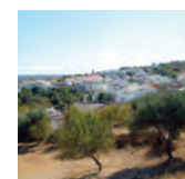
Vista de Boliqueime