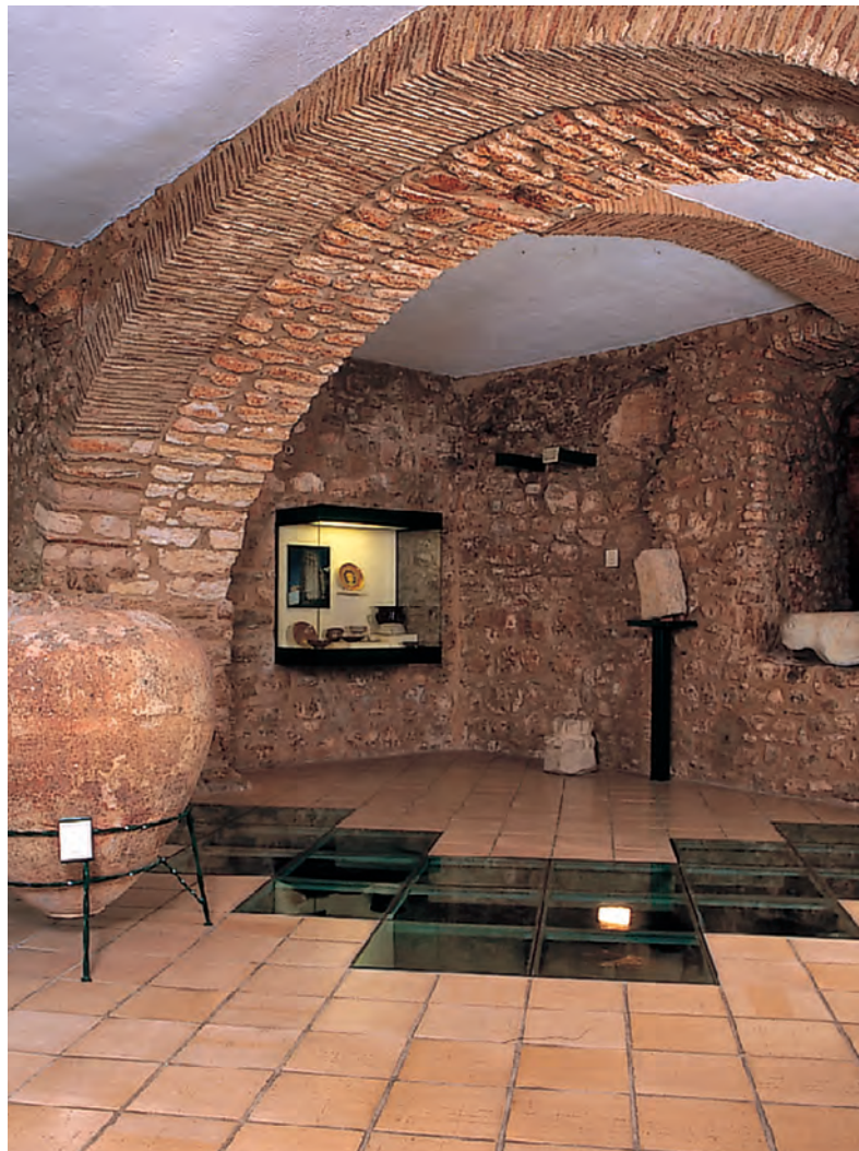
12 Museu Arqueológico Municipal