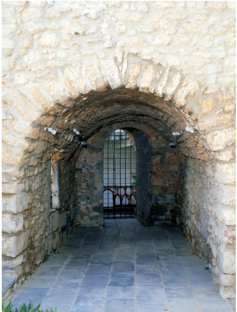
12 Castelo de Loulé