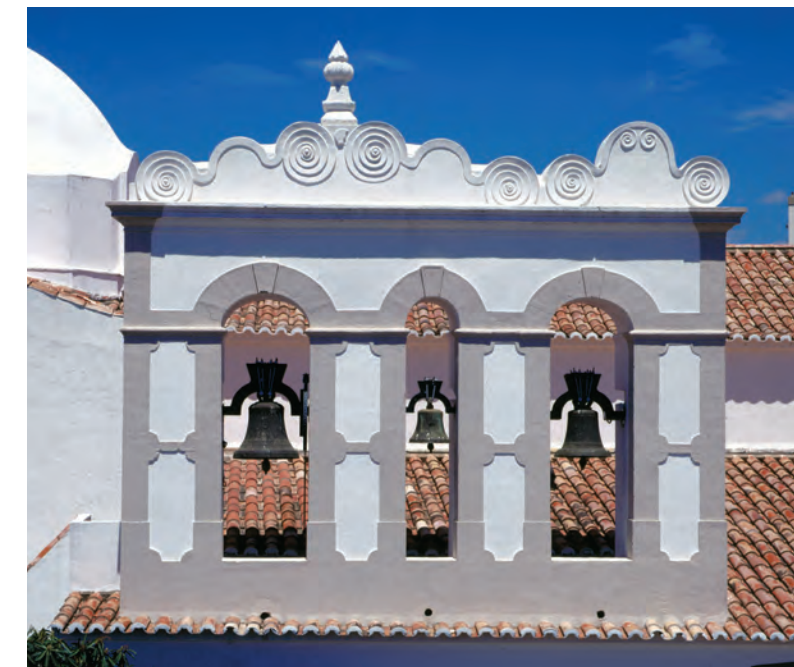
16 Igreja de S. Francisco

Convento do séc.XVII/XVIII das freiras Franciscanas de N. Srª da Conceição. Sofreu grandes estragos com o terramoto de 1755