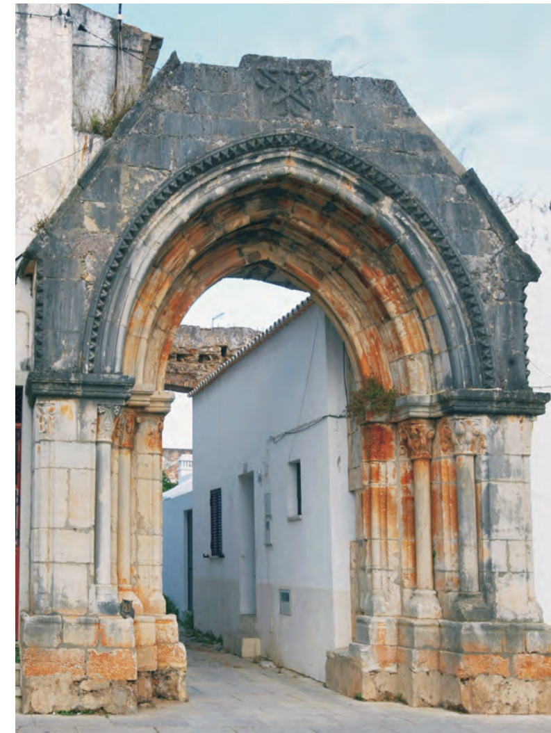
05 Convento da Graça

Resta o pórtico gótico com capiteis de decoração vegetal.