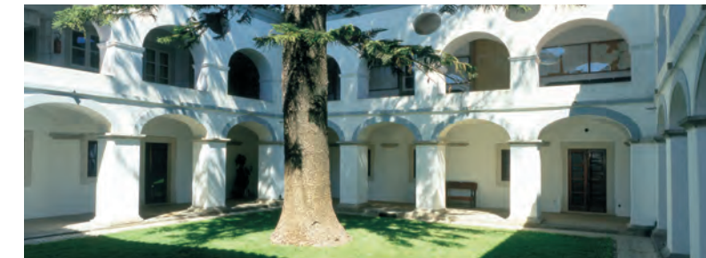
11 Convento Espírito Santo

Resta o pórtico gótico com capiteis de decoração vegetal.